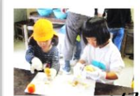
野外でカレーライス作り！