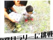
動物発見ラリーに挑戦！