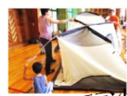
家族で協力してテント設営！

2日目は、ごはん・おかず・かまどの3つの係を、他の家族と分担して、みんなでカレーライスを作りました！活動を通して、他の家族と仲良くなる参加者もいて、嬉しく思いました。雨の影響で活動の変更もありましたが、楽しい思い出がたくさんできました！