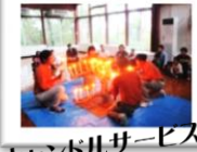
キャンドルサービス！