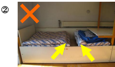
③ め おり目の やま 山が むかい むかい あ 合わせになっていない