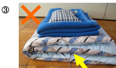
④ かけ かけぶとんの め おり目が2つに見えない

※ うらめん 裏面の正しい お 置き方を さんこう 参考にして、 かくにん みんなで確認しましょう！