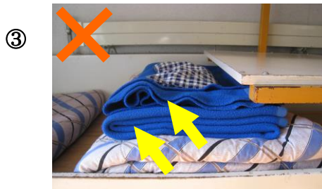
② もうふ 毛布の め おり目が2つではない