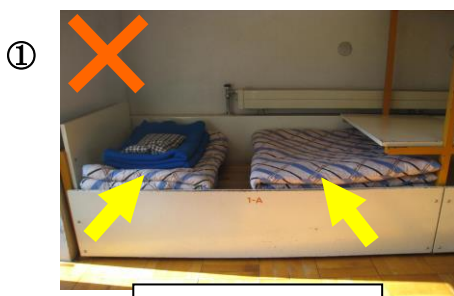
① お 置く ばしょ 場所が はんたい 反対